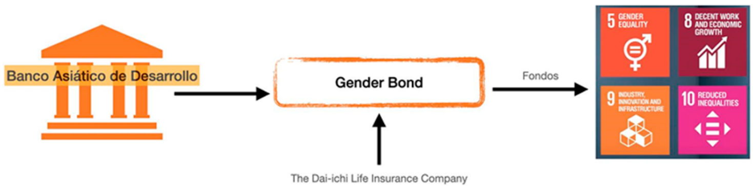
Imagen 2. Esquema de la emisión.

En la imagen 2 se puede apreciar un esquema de la emisión del BAD y como los fondos recaudados para financiar proyectos de género no solo se enmarcan dentro del ODS número 5 (lograr la igualdad entre los géneros y empoderar a todas las mujeres y las niñas) ya que los fondos contribuirán a los siguientes 4: