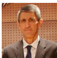
Autor: José M. Domínguez Martínez Director del Proyecto Edufinet

Recientemente se ha publicado el segundo informe de la Autoridad Bancaria Europea (EBA, por sus siglas en inglés) referente a la educación financiera 1 . Para los programas de educación financiera surgidos al margen de las instancias oficiales, como es el caso de Edufinet, resulta fundamental poder conocer, a través de ese tipo de documentos, cuáles son las tendencias imperantes en el panorama internacional en dicho ámbito y qué pautas son las más adecuadas a fin de lograr una mayor eficacia en los objetivos pedagógicos marcados.